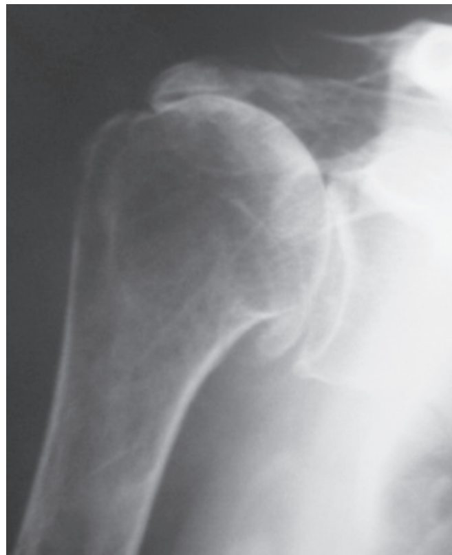
Figura 2 – Imagem radiográfica pré-operatória de ombro direito (caso 11) evidenciando artropatia por lesão do manguito rotador classificada como Hamada IV e Visotsky IIA. Este é um caso em que se observa a acetabulização.

Exames radiográficos foram realizados em todos os pacientes seguindo a padronização proposta por Do- neux et al , para permitir melhor avaliação pré e pós- operatória (9) (figura 1).