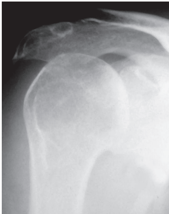
Figura 1 – Imagem radiográfica pré-operatória de ombro direito (caso 1) evidenciando artropatia do ombro por lesão do manguito rotador classificada como Hamada IV e Visotsky IA