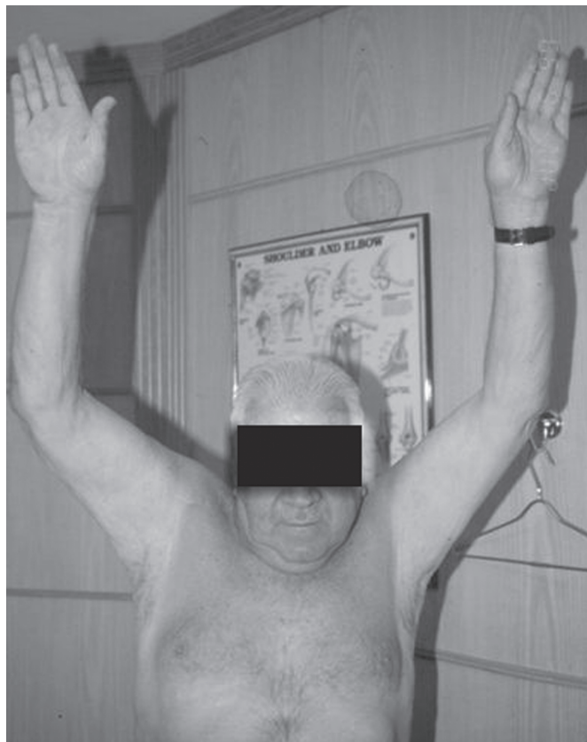
Figura 4 – Imagem de paciente (caso 1) no pós-operatório tardio, classificado como resultado satisfatório

pacientes em relação ao alívio da dor foi de 81,8% (tabela 1).